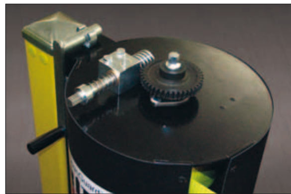
Schwarzer Stahlbehälter mit 20:1 Übersetzung für leichte Bedienung