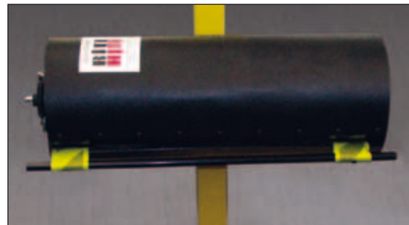
Behälter kann für die Lagerung um 90° gedreht werden.