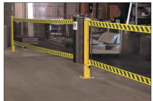
Erweiterung einzelner SpanGuard-Elemente durch gemeinsame Pfosten