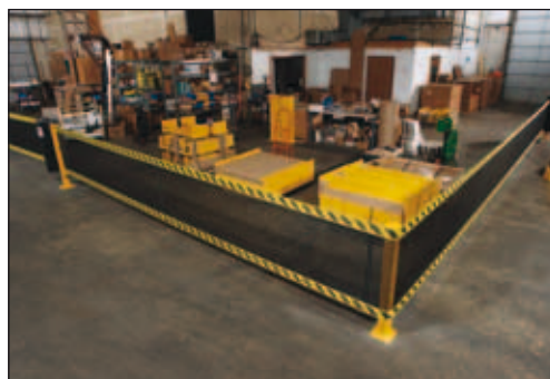
Vielseitig anwendbar, mit Eckpfosten erhältlich

SCHÜTZEN SIE MITARBEITER UND MATERIAL VOR GEFAHREN